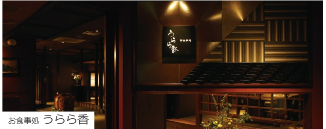
お食事処 うらら香

ブラックとゴールドを基調とした高級感溢れる空間デザインの「ロイヤルグランシャリオ」。全国から取り寄せた旬な厳選食材で作られる多彩な料理、色鮮やかでインスタジェニックな絶品スイーツなど、日常では味わうことのできないホテルクオリティの王道ビュッフェをお楽しみください。季節ごとに異なる旬の厳選食材を使用した和会席をお楽しみいただける、半個室の食事処「うらら香」もご用意しています。