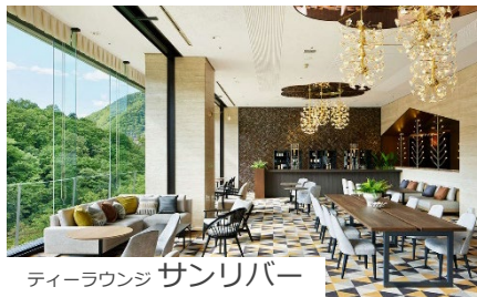
ティーラウンジ サンリバー