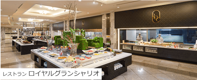
レストラン ロイヤルグランシャリオ

全国屈指の名湯、定山溪温泉。広々とした大浴場「湯酔郷」と、地上60mのホテル最上階から定山溪の景観を楽しめる展望大浴場「星天」をご用意しています。湯量豊富な名湯が、あたたかく包んでくれる至福のひとつをお楽しみください。