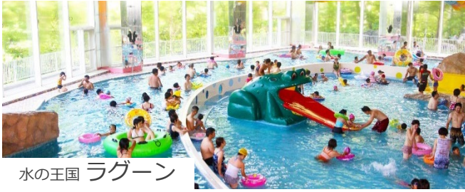
水の王国 ラグーン