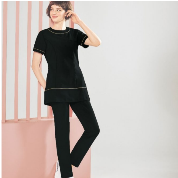
〈マリークウント〉 パイピングデザインストレッチチュニック ■価格：8,789円 ■サイズ：S~3L ■色：ホワイト、グレージュ、ブラック