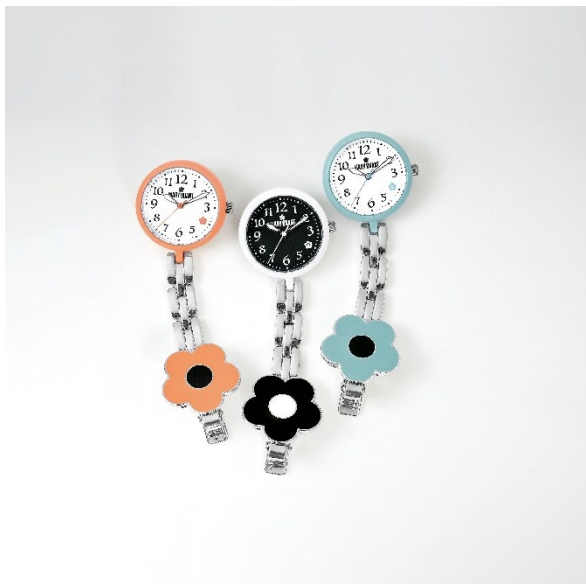
〈マリークウント〉 チャーム付きナースウォッチ ■価格：3,289円 ■色：ブラック、マリーゴールド、ミントブルー