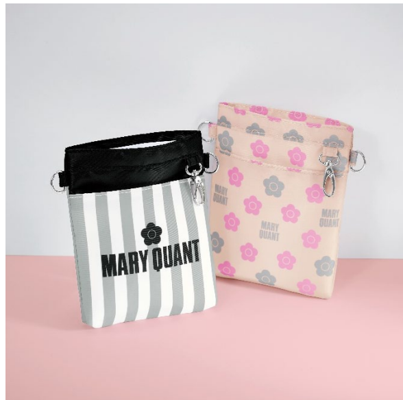
〈マリークウント〉マルチペンケース ■価格：2,739円 ■色：グレーストライプ、パールピンク