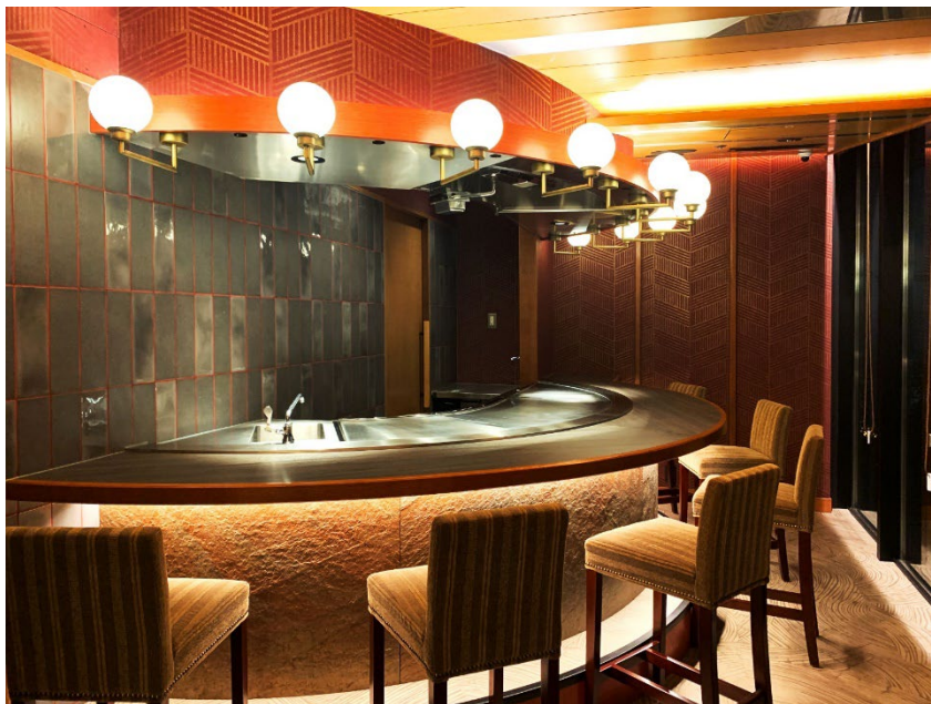
銀座のステーキ 公式WEBサイト… https://www.ginzano.jp/steak/